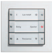
Gira tastsensor 3 3-kanals, renhvit glanset Gira E2, renhvit glanset