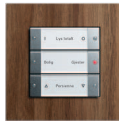
Gira tastsensor 3 3-kanals, farge aluminium Gira Esprit, nøttetre-aluminium