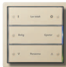
Gira tastsensor 3 3-kanals, kremhvit glanset Gira F100, kremhvit glanset