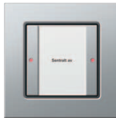
Gira 1-kanals tastsensor 3 Basis Gira E22 aluminium

Med Gira tastsensor 3 kan du styre de forskjellige tilkoblede busfunksjonene som f.eks. lagre lysscener eksternt og hente dem frem, tenne, slukke og dimme lamper eller betjene persienner. Hver knapp har to røde LED-er som viser statusen til den tilordnede funksjonen. Tekstfeltet har en svak bakgrunnsbelysning som gjør det lett å finne tastsensoren og å lese teksten også i mørket.