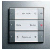
Gira tastsensor 3 3-kanals, farge aluminium Gira E2, farge aluminium