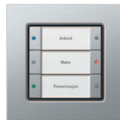
Gira 3-kanals tastsensor 3 Komfort Gira E22 aluminium