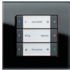
Gira tastsensor 3 3-kanals, antrasitt Gira Esprit, glass svart