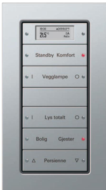
Gira 5-kanals tastsensor 3 Komfort, Gira E 22 aluminium