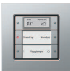
Gira 2-kanals tastsensor 3 Plus Gira E22 aluminium

Gira tastsensor 3 Plus har i tillegg en integrert romtemperaturregulator og et display med høy kontrast for visning av regulatorstatus, temperatur og forskjellige meldinger som kan mottas via KNX/EIB-systemet. I nattmodus har displayet en hvit bakgrunnsbelysning og gjør det mulig å vise verdier og meldinger i ulike størrelser eller visningsmodi. I forbindelse med bustilkobling 3 med eksternt følertilkobling kan det kobles til en eksternt temperaturføler, f.eks. til gulvvarme.