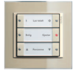
Gira tastsensor 3 3-kanals, kremhvit glanset Gira Event Clear, sand