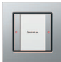
Gira 1-kanals tastsensor 3 Komfort Gira E22 aluminium

Gira tastsensor 3 Komfort har LED-er med tre farger for statusvisning. LED-ene kan programmeres fleksibelt for mer komplekse bruksformer. Videre er det integrert en temperatursensor som kan kobles i nett med andre komponenter i KNX/EIB-systemet. I tillegg kan hver knapp tilordnes en overordnet prioritert statustilbakemelding, f.eks. for alarmmeldinger eller opplysninger som vindalarm.