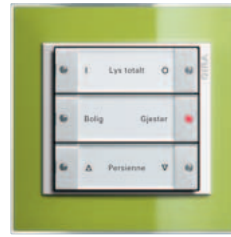
Gira tastsensor 3 3-kanals, renhvit glanset Gira Event Clear, grønn