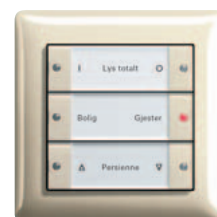
Gira tastsensor 3 3-kanals, renhvit glanset Gira Standard 55, renhvit glanset