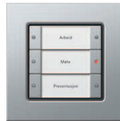
Gira 3-kanals tastsensor 3 Basis Gira E22 aluminium