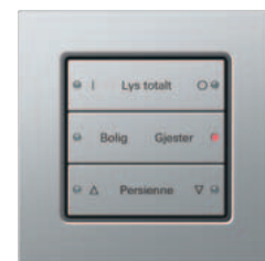
Gira tastsensor 3 3-kanals, edelstål med laser-skilttekst Gira E 22, edelstål