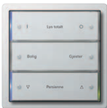
Gira tastsensor 3 3-kanals, renhvit glanset Gira F100, renhvit glanset