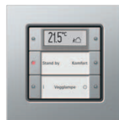
Gira 2-kanals tastsensor 3 Plus Gira E22 aluminium