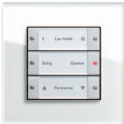
Gira tastsensor 3 3-kanals, renhvit glanset Gira Esprit, glass hvitt